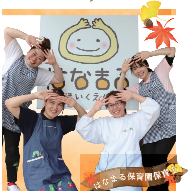
はなまる保育園保育士