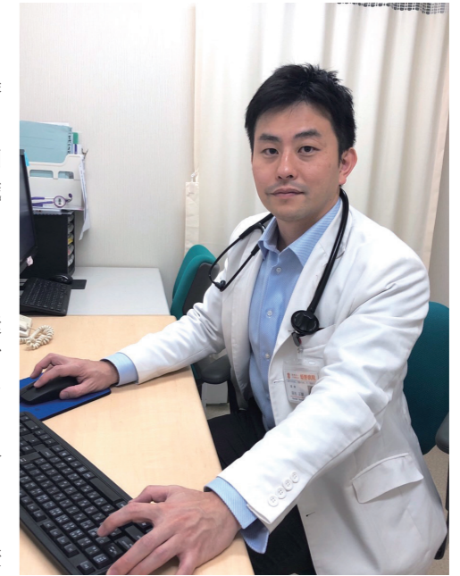
プライマリ・ケア学会認定指導医 在宅医療認定専門医

外来・入院・在宅・救急診療に渡って幅広く様々な健康問題に対応させていただきます。何科にかかったらよいかわからない、多数の問題を抱えている、家族の相談をしたい、親子で一緒に受診したい、という方は是非一度ご相談ください。