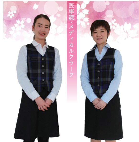
医事課・メデイカルクラーク